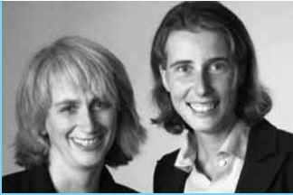
PUSH!-CampusAgentur FHT Esslingen, FHT Stuttgart und Hochschule Nürtingen-Geislingen

Die Beraterinnen und Berater der Campus-Agenturen informieren bei Fragen zur gründungsbezogenen Weiterbildung, vermitteln kompetente Fachberater aus dem PUSH! Partnernetzwerk, unterstützen bei der Beantragung spezieller Zuschüsse sowie Förderungen und stehen im weiteren Verlauf des Projekts als Ansprechpartner zur Verfügung.