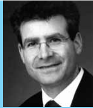
PUSH!-CampusAgentur Universität Hohenheim und Hochschule der Medien

contact-agentur@push-stuttgart.de www.contact-as.de