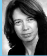
PUSH!-CampusAgentur Universität Stuttgart

www.ibh.uni-hohenheim.de www.mec-online.de